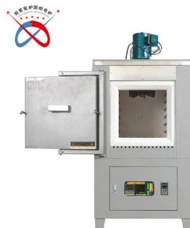
箱式电炉 GWDL-XL 加功能 C-X-Z