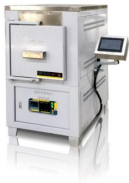
箱式电炉 GWDL-XL 加功能 C