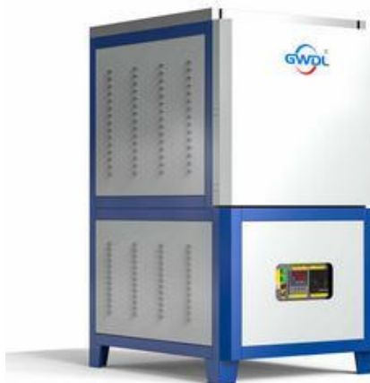
箱式电炉 GWDL-XL 加功能 S