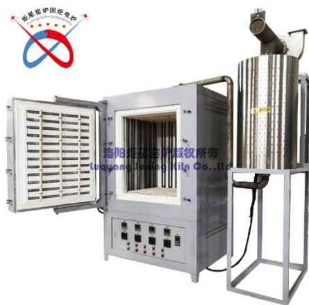
箱式电炉 GWDL-XL 加功能 C-X3-V